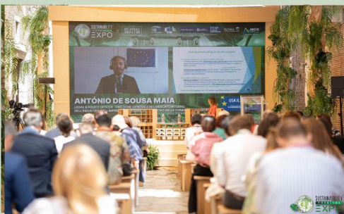
PERCORSO NEGLI SDGs DELL'AGENDA ONU 2030