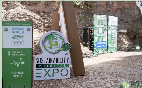
SFILATA NARRATA® NEI FORI IMPERIALI